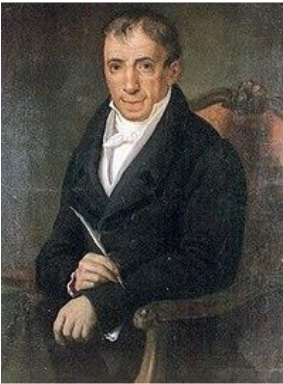
Ο Αδαμάντιος Κοραΐς